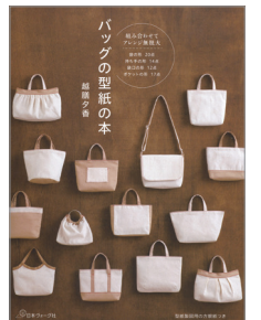
※この写真はイメージです。