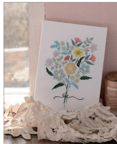
※この写真はイメージです。