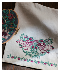
※この写真はイメージです。