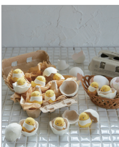
※この写真はイメージです。