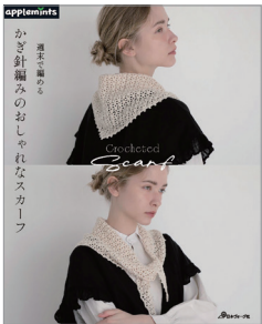
※この写真はイメージです。