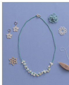
※この写真はイメージです。