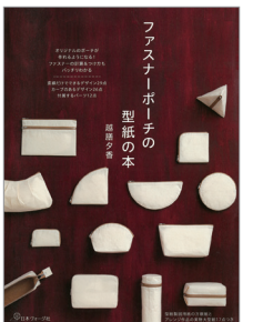
※この写真はイメージです。