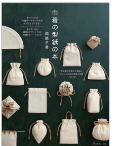
※この写真はイメージです。