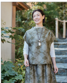
※この写真はイメージです。