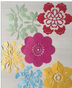
※この写真はイメージです。