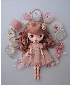
※この写真はイメージです。