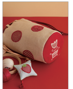
※この写真はイメージです。