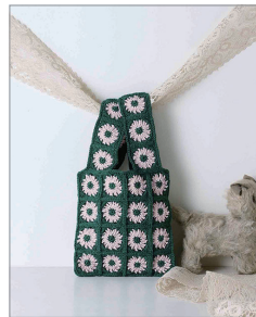
※この写真はイメージです。