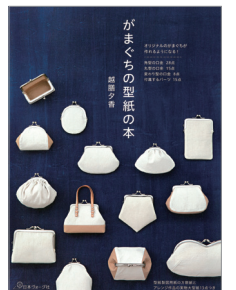
※この写真はイメージです。