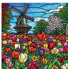
※この写真はイメージです。