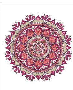
※この写真はイメージです。