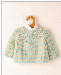
※この写真はイメージです。