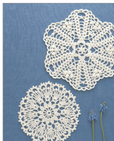
※この写真はイメージです。