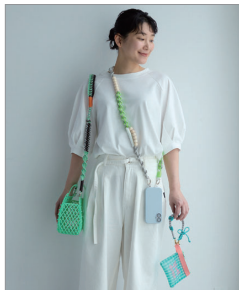
※この写真はイメージです。